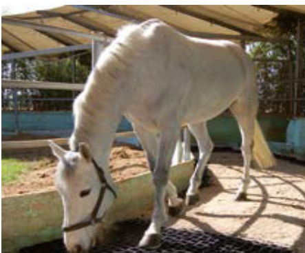
כוח דחיסה מעולה