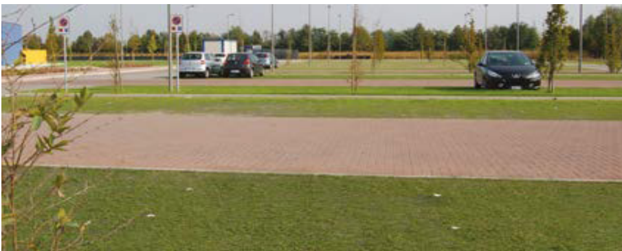
חניונים ציבוריים ופרטיים